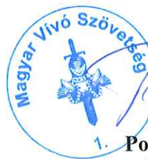
1. Polgár Pál főtitkár